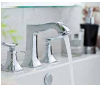
Protege de averías en electrodomésticos y en la grifería.