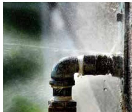
Evita las corrosiones por punto.