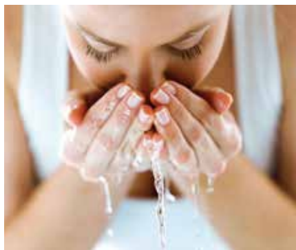
Mejora de la calidad del agua. Más limpia, clara y cristalina.

El objetivo de estos filtros es proteger tanto la conducción del agua como los aparatos conectados a ella, de las partículas arrastradas por el agua, reteniéndolas y evitando daños posteriores.