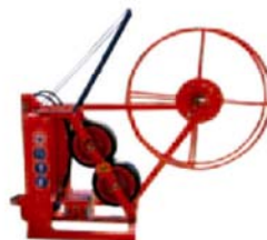
Máquina de recolección hidráulica

FlexNET® es un tubería liviana que permite su recolección desde un lateral del campo.