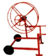
Máquina de recolección manual